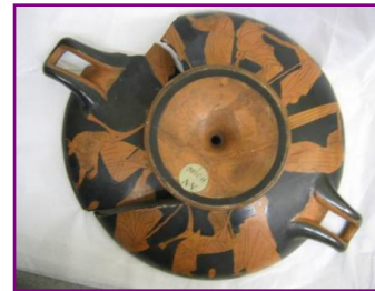
Coupe à figures rouges, Vème siècle