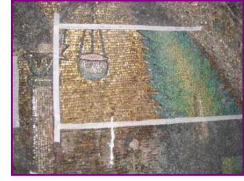
Mosaïque VIème siècle, Monastère Mar Gabriel (Turquie)

Siège Social : 41, rue des Chantiers - 78000 VERSAILLES - Tel : 01.39.51.02.84 - Fax : 01.39.51.04.74 Bureau Parisien : 52 rue St Lazare - 75009 PARIS Atelier de restauration-conservation : Paris